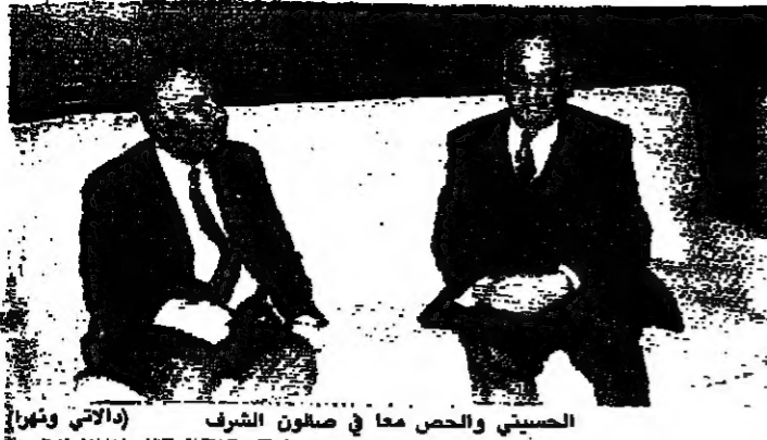
الحسيني والحصى معا في صالون الشرف (الراي ونورا)

غادر الرئيس حسين الحسيني وسلم الحصى الى تونس عن طريق باريس. وتحت إشراف مفتي الجمهورية الشيخ خالد التوفيق في اجتماعهما مع اللجنة الوزارية العربية، معربا عن أمه في أن يكون هذا الاجتماع بناء وان تمهيد له المناقشات التي ساعدته على أن يكون الإطار الذي يحقق لنا ما نصبو إليه من أمل ونطمح.